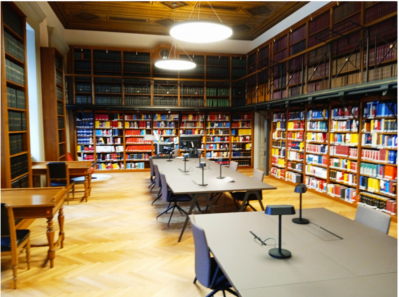
Blick in die Parlamentsbibliothek

zeigte sich begeistert vom neuen multimedialen Angebot, das fachlich und didaktisch sehr gut aufbereitet wurde.