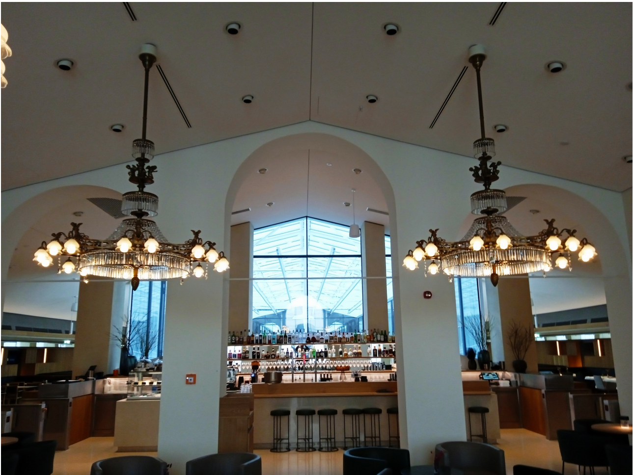
KELSEN IM PARLAMENT - Restaurant, Cantina, Bistro, Events

Vom Besucher:innen-Zentrum „ Demokratikum “ aus starten die Führungen im Parlamentsgebäude, und von hier führen auch Lifte in das neue, öffentliche Dachrestaurant KELSSEN IM PARLAMENT. Das Haus am Ring wurde in den Jahren 1874 bis 1883 nach Plänen des Architekten Theophil HANSEN erbaut, die umfassende Sanierung fand von 2018 bis 2022 statt und ist insgesamt als gelungen zu bezeichnen. Wichtig ist, dass im Parlament die Anliegen der nationalen Minderheiten (Volksgruppen) in Österreich stärker berücksichtigt werden als bisher, da die Volksgruppensprachen in ihrer Existenz stark gefährdet sind – sowohl in Kärnten als auch im Burgenland.